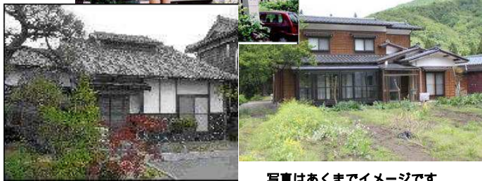
写真はあくまでイメージです。